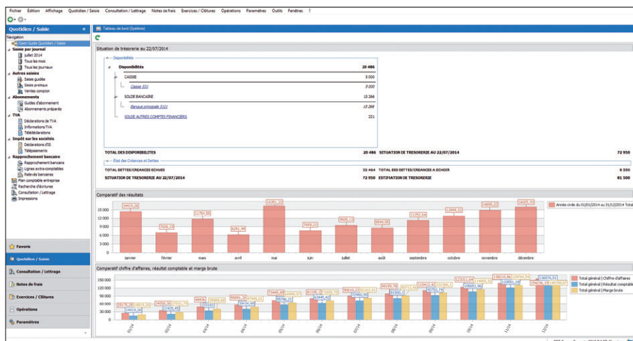
Grâce au tableau de bord, visualisez rapidement les indicateurs clés de votre entreprise : chiffre d'affaires, résultats, etc.

Suivez votre situation de trésorerie en temps réel. Grâce à des tableaux de bord pré-paramétrés, les chiffres clés de votre entreprise sont à portée de main, partout et tout le temps. D'un coup d'œil, visualisez les indicateurs de performance : chiffre d'affaires, résultat comptable, marge brute, trésorerie, etc. Grâce aux liens hypertextes, d'un simple clic vous ouvrez une fenêtre pour avoir plus de détails sur une information. Ainsi, vous accédez rapidement à toutes vos données importantes et réagissez aussitôt.